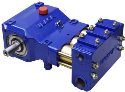
P3-10 Version A1, 250 bar (3,630 psi)

www.uraca.de; info@uraca.de Telefon +49 (0) 7125 133-0 Telefax +49 (0) 7125 133-202