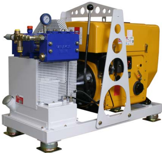
Hochdruck-Pumpenaggregat P3-10D mit Dieselantrieb

Pumpe, Aggregat, Spritzpistolen und Zubehör bedeuten Vollsoriment aus einer Hand. Bewährte URACA-Qualität, bester Service sowie ein top Preis-/Leistungsverhältnis machen Aggregat und Pumpe zur ersten Wahl. Ob in der Nachrüstung oder Erstausrüstung, diese Pumpe veredelt als Komponente jede Anlage.