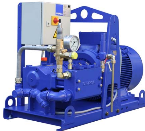
Hochdruck-Pumpenaggregat P3-10E mit Elektroantrieb